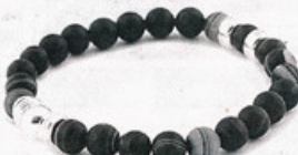
Bracelet Be Relaxed noir fait d'agates et d'argent, 75 $. Pour connaître les points de vente: www.bebluebijoux.com