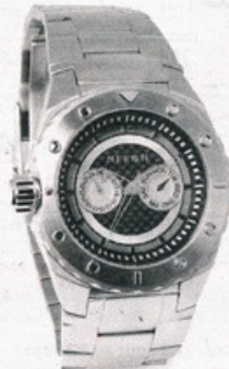
Les montres Néron Homme se détaillent entre 295 $ et 350 $, en vente dans les boutiques et comptoirs Bijoux Caroline Néron.